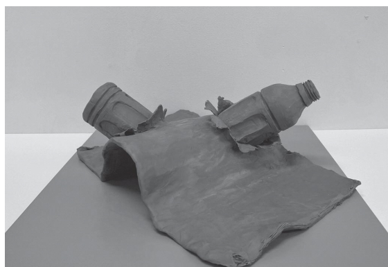
令和4年度一般入試A実技試験(立体)の作品